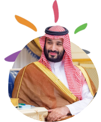
صاحب السمو الملكي الأمير محمد بن سلمان بن عبدالعزيز آل سعود