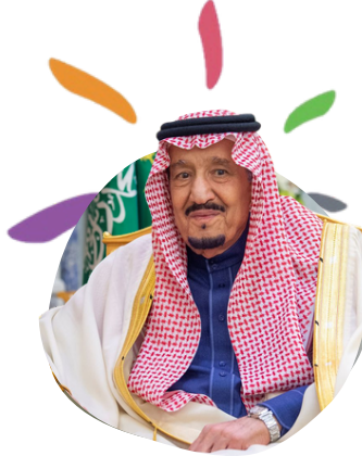
خادم الحرمين الشريفين الملك فهد بن عبدالعزيز آل سعود