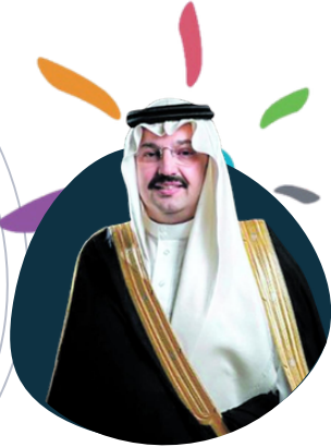
الملك سلمان بن عبدالعزيز آل سعود مركز طلال بن عبدالعزيز آل سعود